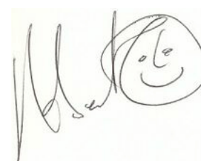
14 novembre 2002: La prima festa - Autografo di Roberto Piumini